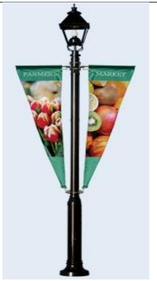
Tip 1. Dvostrani svijetleći reklamni pano.